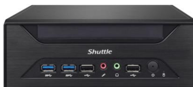
XH110 (mit ODD-Schacht)