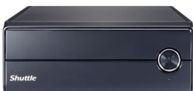
XH110V (mit Klappen)