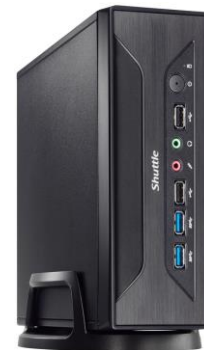
Optionales Zubehör: Standfuß PS01