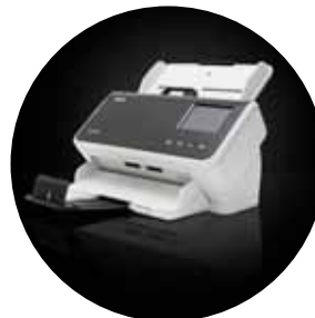
Alaris S2060w/S2080w Scanner