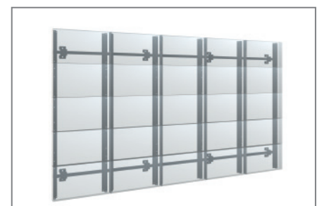
Halterung unsichtbar hinter der Technik