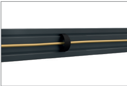
Kabelführung mittels Clips

Neben den vorkonfigurierten Systemen bietet HAGOR kundenspezifische Sonderlösungen im LED-Bereich an, welche abgestimmt auf alle Bedürfnisse mit Zubehör wie z. B. Lautsprechern, Steuerungen etc. individualisiert werden können.