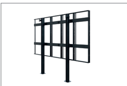
geringer Platzbedarf dank Boden Wand Montage