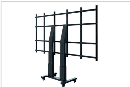
Kein Fineadjustment notwendig